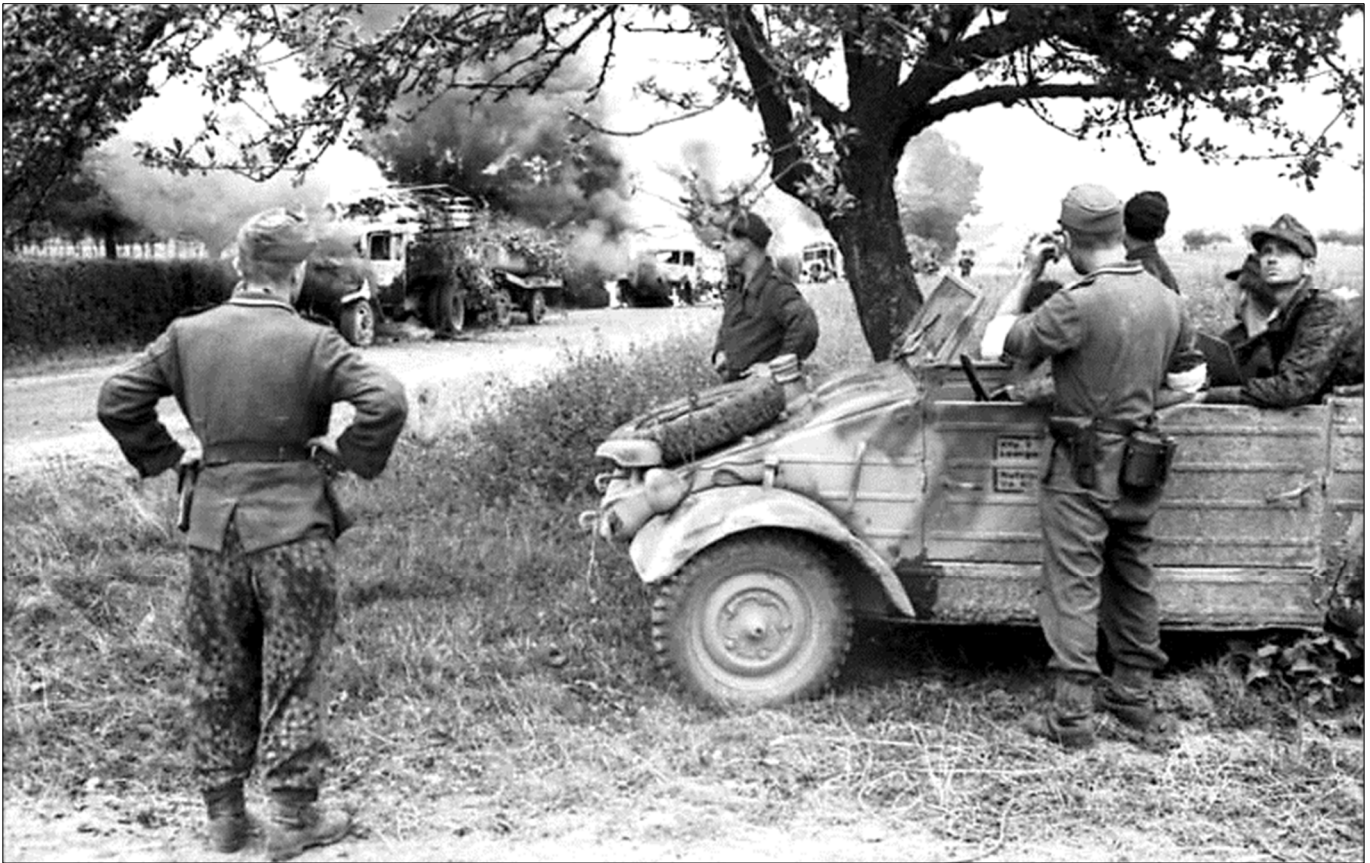
Eine deutsche Kolonne unter Beschuss durch alliierte Tiefflieger. Der Kübelwagen im Vordergrund wurde gegen Fliegersicht getarnt unter einem Obstbaum abgestellt. Der Soldat im Fond des Wagens sucht den Himmel auf feindliche Flieger ab (Bilder)