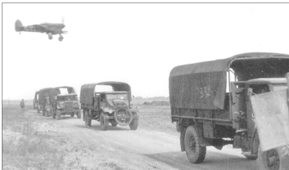
Hawker Typhoon überfliegt eine britische Kolonne an der Normandiefrent (Oben)