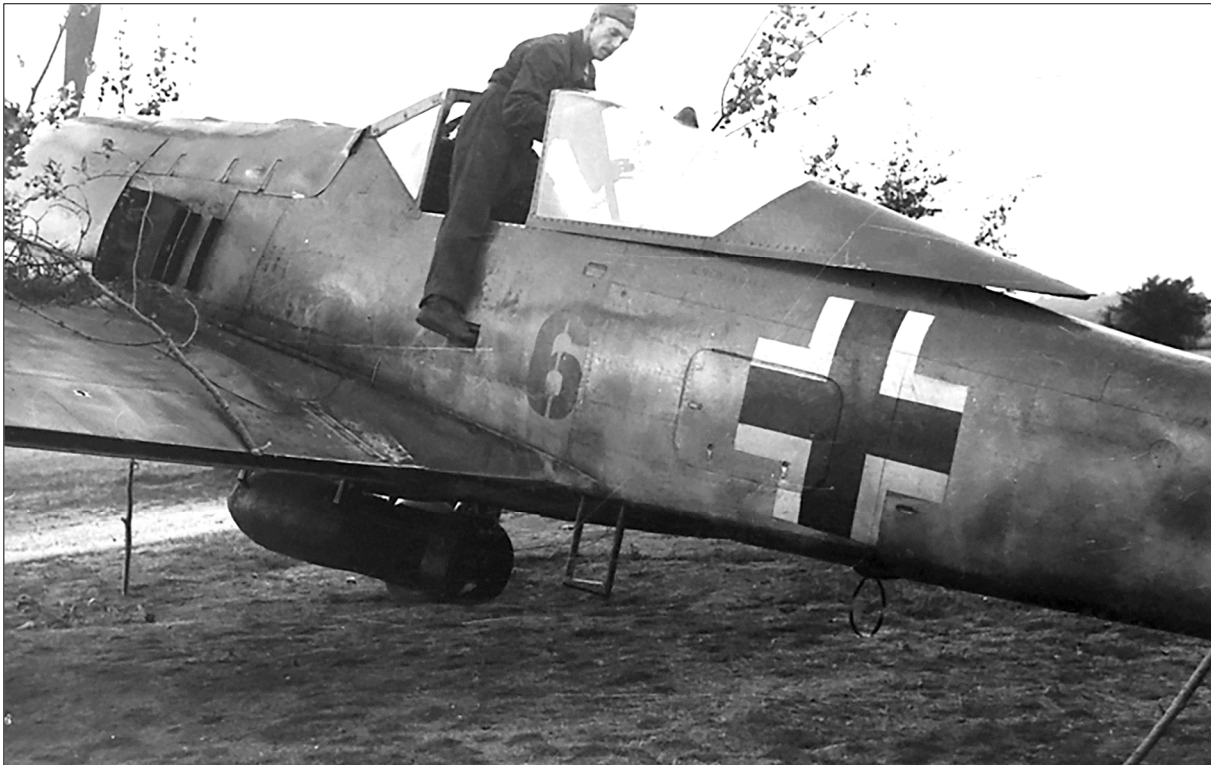
Eine Focke Wulf Fw 190 wird zum Einsatz vorbereitet (Bild oben)

Stab JG 2 / Focke Wulf Fw 190 A-8 / # 731065 / Luftkampf mit P-47 Thunderbolts / Absturz nahe Berchères sur Vesgre, östlich Anet (Région Centre) - Frankreich / Leutnant Hans-Joachim Kuhn / Fallschirmabsprung - verwundet