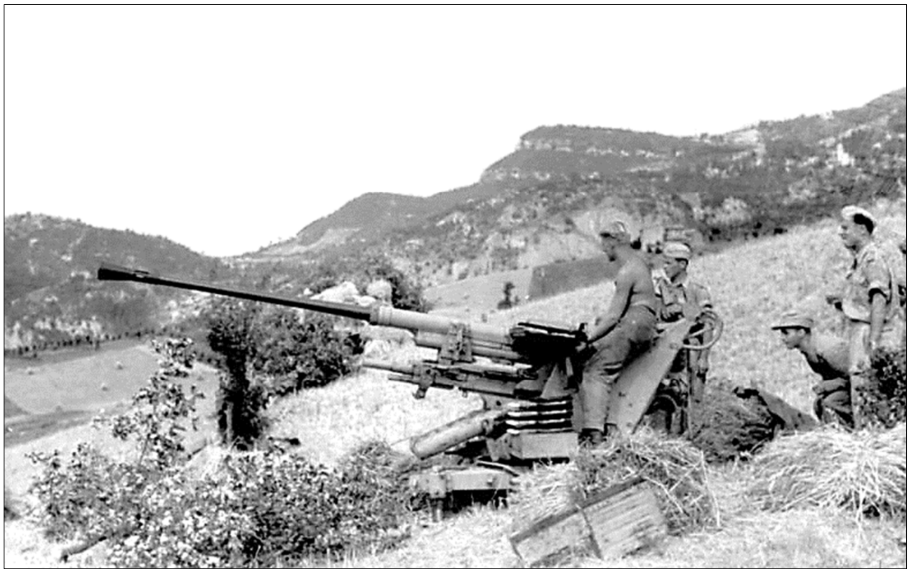
Deutsche Flak in Italien 1944 (Oben)

GCII/3 / Dauphine / Republic P-47 D-22-RE Thunderbolt / # 42-26159 / Beschuss durch Flak - 1./3./schwere Flak-Abteilung 212 (v) + 1./2./leichte Flak-Abteilung 99 (mot.) / Absturz nahe Montefalcone, östlich Pisa (Region Toskana) - Italien / Sergeant Jean Lacassie / Fallschirmabsprung - Flucht