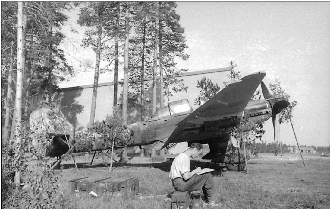
Junkers Ju 87 D-5 - Gefechtsverband Kuhlmeier auf dem Platz Immola (Oben)

8./SG 3 / Focke Wulf Fw 190 F-8 / # 930536 / Beim Start ausgebrochen - Flugplatz Idriza (Їдрица - Oblast Pskow) - Russland / Oberfeldwebel Gerhard Walter / Verletzt